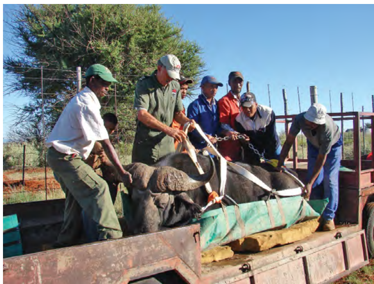
Lekker dik matrasse werk baie goed as sagte beddegoed. So nie kan dik hooi of lusern gebruik word.