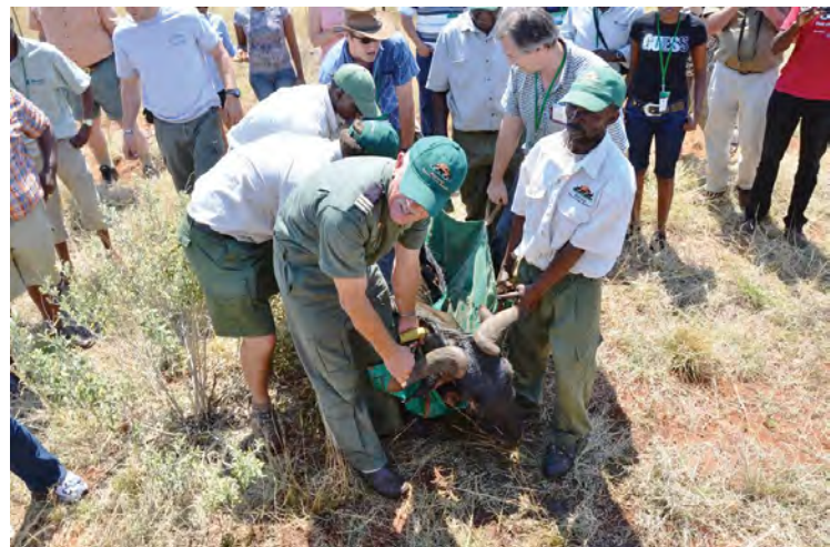
Versprei die helpers rondom die dier en tel hom gelyk op met sy kop op en sy bek ondertoe.

Die kalmeermiddels wat op warm dae gebruik word en die korrekte teenmiddels is van kardinale belang om die uitwerking van die verdowing so spoedig moontlik te neutraliseer – die diere moet so gou moontlik self termoreguleer omdat die meeste kalmeermiddels termoregulering uitskakel.