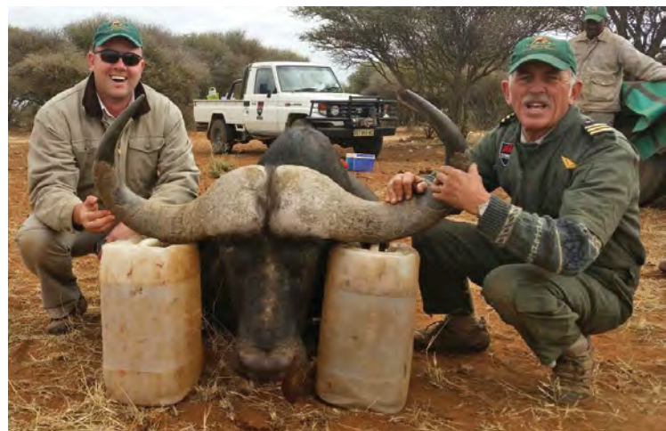
Hou altyd kanne water byderhand om diere mee af te koel. Trek die tong uit om slym uit die bek te laat loop soos hier aangedui word. Hou altyd die kop na bo en die neus na onder om die lugweë oop te hou.