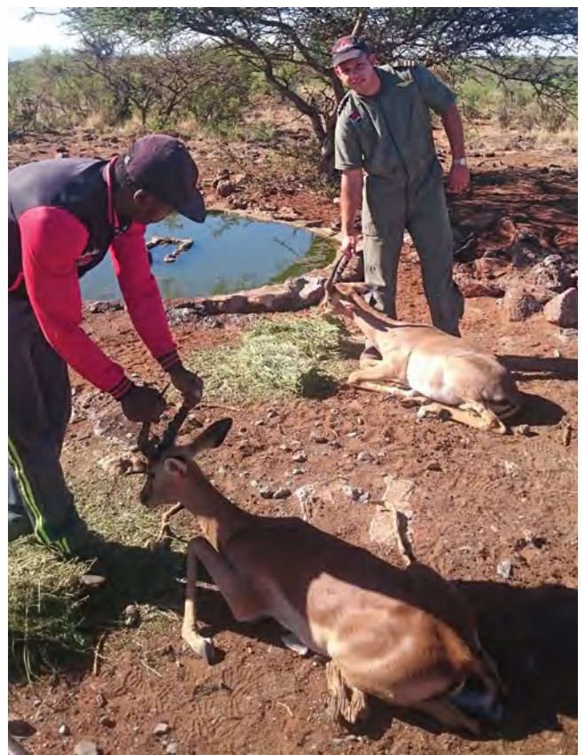
Maak altyd diere naby water wakker, veral in groot gebiede.

Dit klink dalk na baie eenvoudige en logiese metodes maar wees gewaarsku: Hierdie paar wenke kan deurslaggewend wees vir die oorlewing van jou diere en vrektes beperk. 🐾