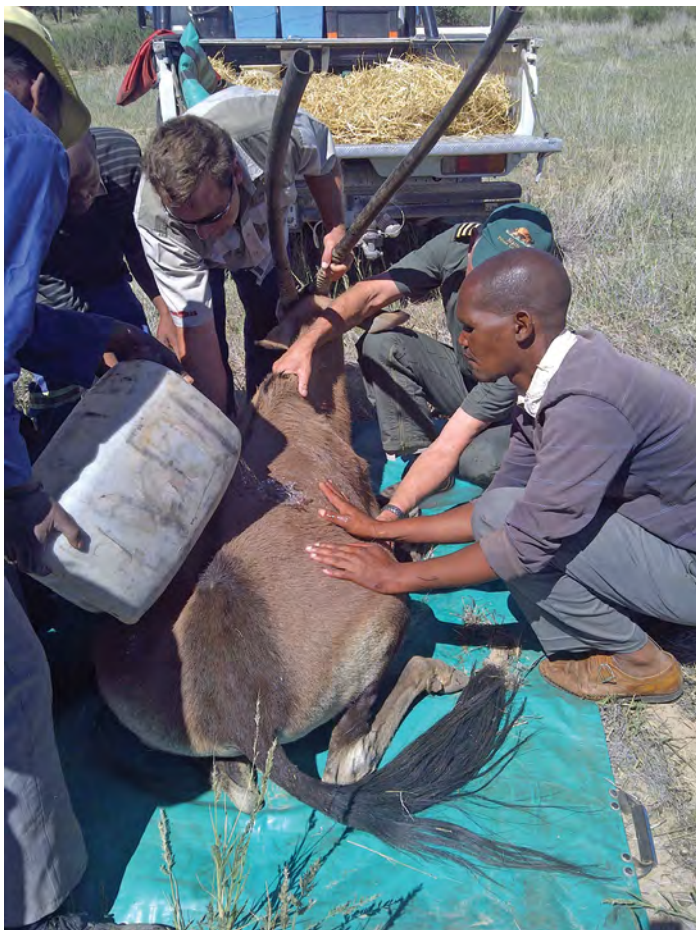
Gooi onmiddellik water oor die dier as hy warm voel en vryf sy vel van onder af boontoe.

konduksie is dus baie belangrik by die afkoel van diere. Spuit ook dadelik 'n middel in om asemhaling te verbeter indien die bok baie gehardloop het en na asem hyg.