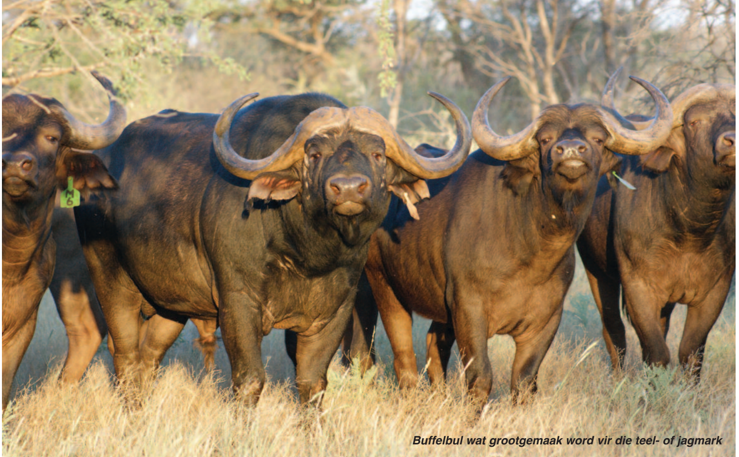
Buffelbul wat grootgemaak word vir die teel- of jagmark