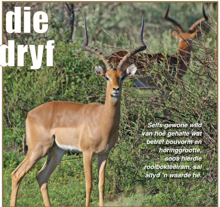
Selfs gewone wild van hoë gehalte wat betref bouworm en horinggrootte, soos hierdie rooibokteelram, sal altyd 'n waarde hê.